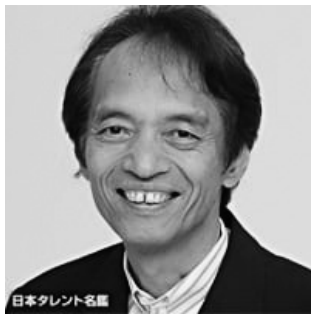
日本タレント名鑑