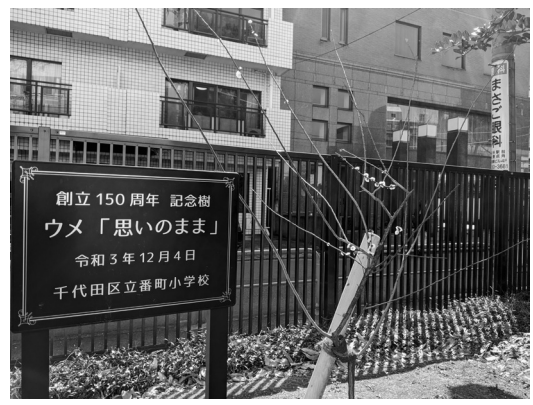
記念樹 梅「思いのまま」

2019年の5月1日に皇太子徳仁親王が天皇に即位し、元号が平成から令和に改められました。「令和」の出典は、「万葉集」の中にある梅花の歌三十二首の序文です。奈良時代の初め、当時の大宰府の長官、大伴旅人の邸宅で開かれた梅花の宴で詠まれました。32人が梅の花を題材に歌ったものをまとめた序文として、大伴旅人自身が書いたものです。